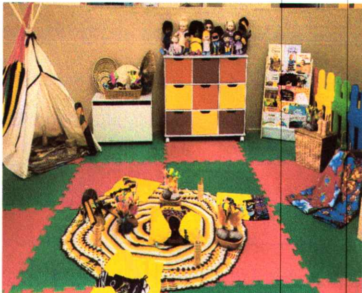
Cantinho da diversidade