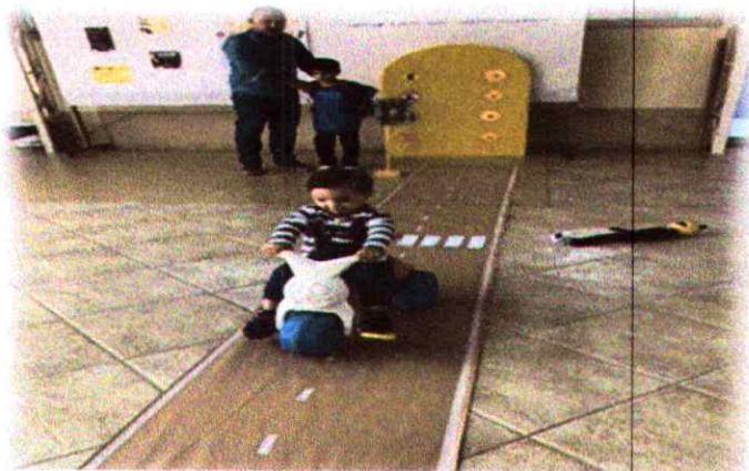
Semana do trânsito (as famílias participaram das atividades)