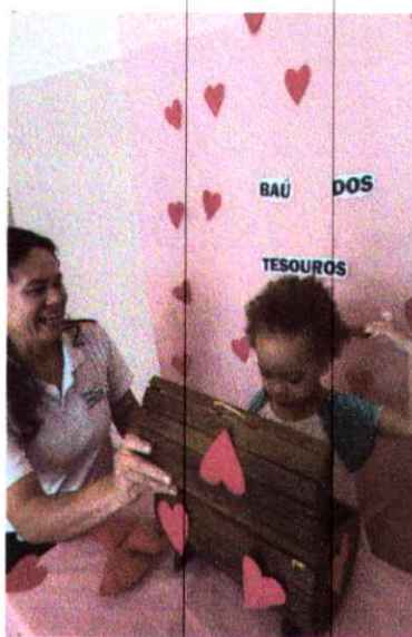
Baú dos tesouros