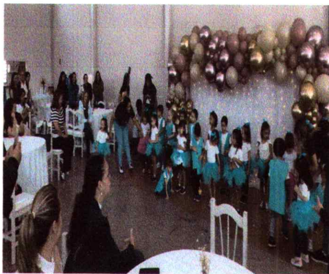
Apresentação musical para Secretaria da Educação